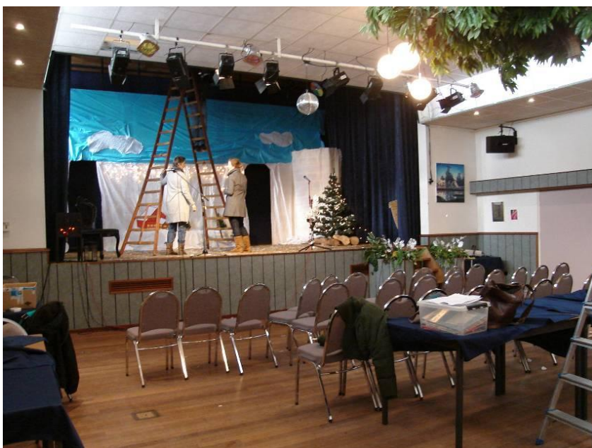
Ontmoetingsruimte de Bijenkorf

Het dorpshuis De Bijenkorf is de belangrijkste voorziening in Oosterend. Dit dorpshuis biedt onderdak aan de vele verenigingen die het dorp rijk is. Volleybal-, gymnastiek- en andere sportverenigingen maken gebruik van de sporthal. Hier hebben ook de kinderen van de basisscholen schoolsport en de ruimte wordt incidenteel gebruikt door mensen die bijvoorbeeld een partijtje willen badmintonnen. De grote feestzaal met podium wordt gebruikt door de toneelverenigingen en voor dansavonden, voor bruiloften, partijen en uitvaarten en door veel losse huurders. De jeugd heeft een eigen onderkomen in de jeugdkelder. Biljartverenigingen kunnen terecht op het biljart in de ontmoetingsruimte, ook de thuishaven voor het dorpservicepunt. Daarnaast biedt het dorpshuis ruimte voor een percussiegroep met majorettes, de damvereniging, linedancing, de bejaardensoos, koersbal en andere verenigingen. Bewoners kunnen er boeken lenen of reserveren bij een grote boekenkast van de Openbare Bibliotheek. En mensen kunnen voor de huisarts, de fysiotherapeut of de pedicure terecht in de medische ruimte. Met al die activiteiten doet het dorpshuis zijn naam 'De Bijenkorf' alle eer aan. Het is een plaats waar vrijwel iedereen uit het dorp jaarlijks wel eens komt: voor een bridgeavond, voor de kerstviering van één van de scholen, kortom: het is een dorpshuis van iedereen.