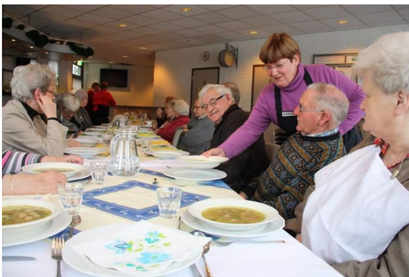
Vrijwilligster serveert de soep in de kantine.