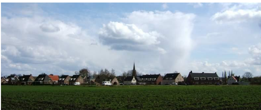
Gezicht op Esbeek.

De sociale status van de gemeente Hilvarenbeek is iets hoger dan het landelijk gemiddelde (SCP, 2006). Het aandeel 75-plussers ligt momenteel in het dorp Esbeek (3,3%) en de gemeente Hilvarenbeek (5,7%) onder het landelijk gemiddelde (6,9%). Verwacht wordt dat in Esbeek het aandeel 75-plussers tot 2030 flink zal stijgen van 3,3% naar 9,8%. Ten opzichte van het verwachte landelijke gemiddelde van 11,5% blijft de vergrijzing echter relatief beperkt ( www.horizonline.nl ).