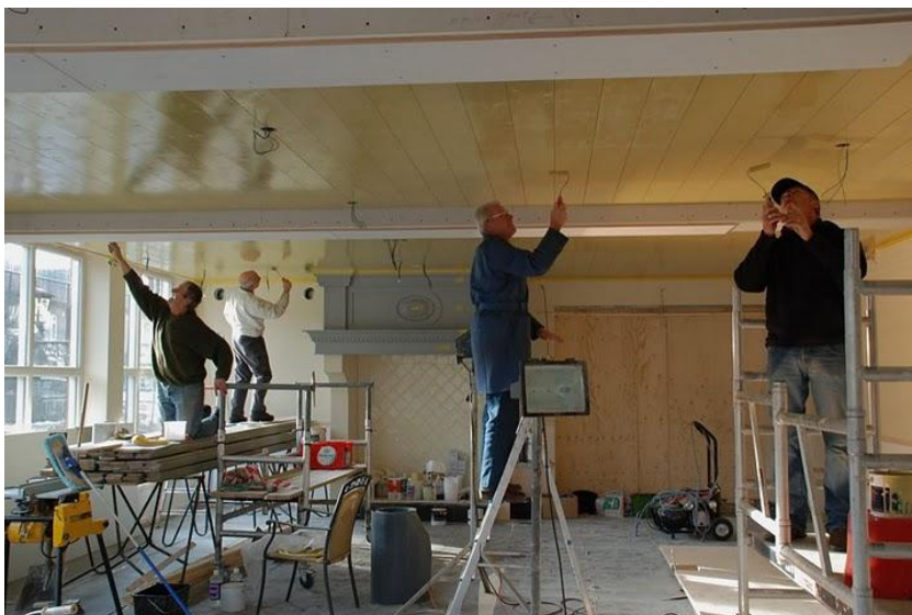
Vrijwilligers helpen bij de verbouwing van het café.