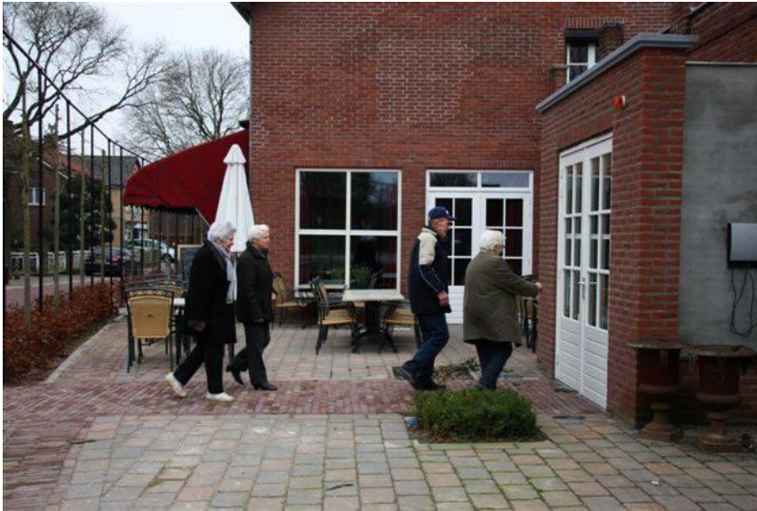
Senioren op weg naar de Dorpshuiskamer.