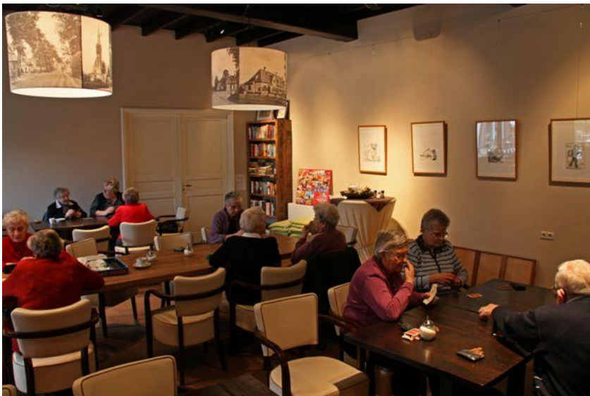
Senioren kaarten en spelen spellen in de Dorpshuiskamer.