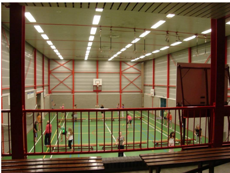
Sporthal de Bijenkorf

In de jaren tachtig van de vorige eeuw is het dorps huis uitgebreid met een sporthal. In 2009 is het opnieuw ingrijpend verbouwd met de inzet van veel vrijwilligers. Voor de financiering is een beroep gedaan op de provincie Noord-Holland, de gemeente Texel, het Oranjefonds, het VSB-fonds, de Rabobank en TESO, de eigen veerdienst van het eiland. Met de gelden is de medische ruimte, een nieuwe hal en de vergaderzaal/ontmoetingsruimte gebouwd. Bij elkaar is dit het huidige dorps servicepunt.