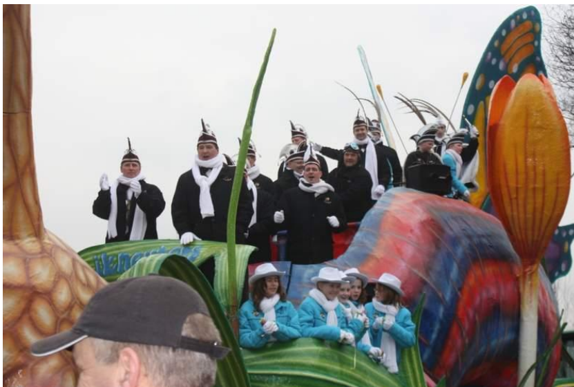
Carnaval in Esbeek 2010.

De basis daarvoor ligt op de basisschool en in het vieren van carnaval. Jongeren die in hetzelfde jaar geboren zijn, blijven vaak voor het leven lang vrienden. Zij zitten samen op school en maken samen carnavalswagens. De geïnterviewden vertellen dat veel bewoners gemakkelijk te bereiken zijn door zo'n vriendengroep aan te spreken. De coöperatie maakt daar dan ook gebruik van, zoals bijvoorbeeld bij het laten afnemen van de enquête. Door de aanwezigheid van de vriendengroepen bestaat in het dorp een soort natuurlijke verbondenheid. Naast de vriendengroepen geeft de aanwezigheid van een groot aantal verenigingen, veertig, ook een indicatie van de sterke onderlinge samenhang.