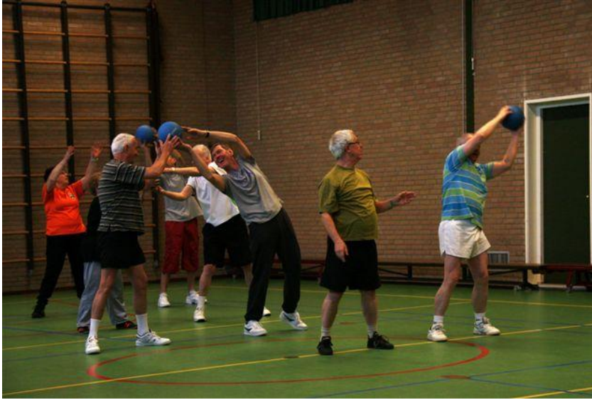
Gym voor 'medioren'.